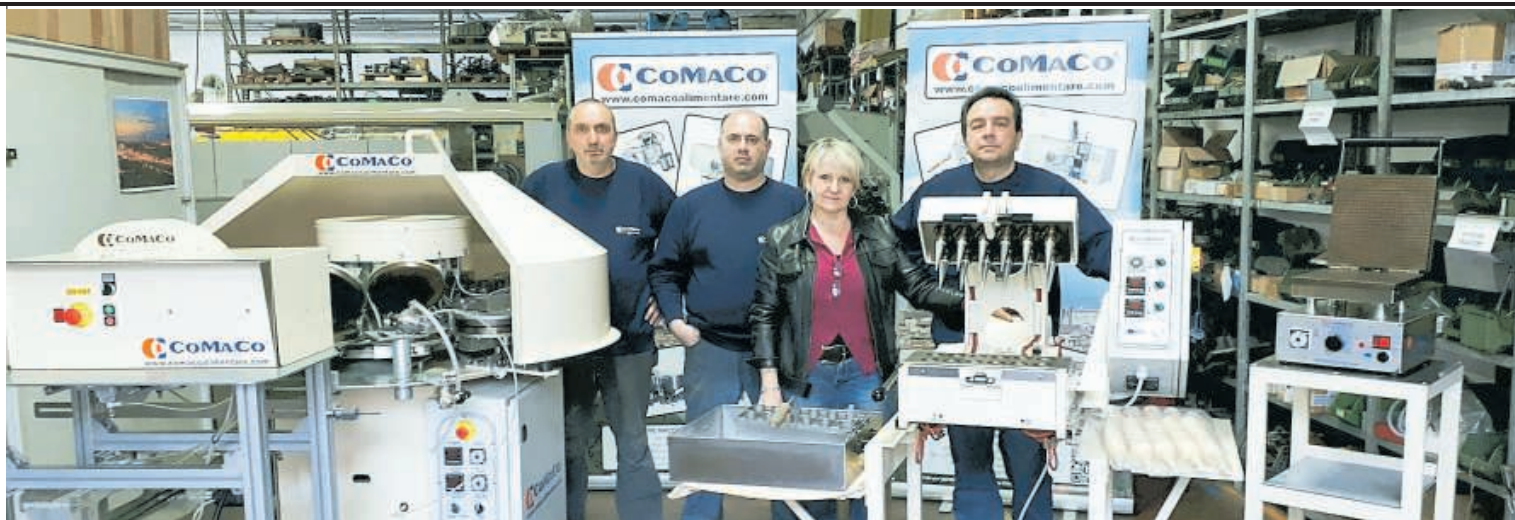
I soci Sono quattro i fondatori della CoMaCo